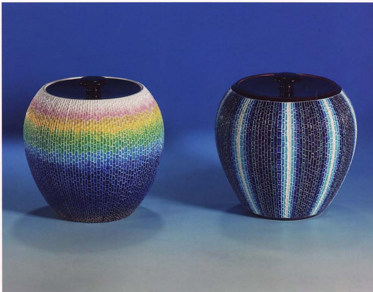
Coachin cray drawing water container Dreams - porcellana tenera - cm. 16x16,2 Coachin cray drawing water container Springhaze - porcellana tenera - cm. 16x16

Kyoto (Giappone), 1971 Vive e opera a Kyoto